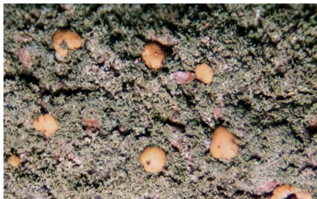
ภาพที่ 1 ไลเคนชนิด Dimerella sp.3